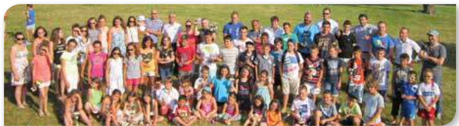
Remise des trophées sportifs aux associations celloises.

Financées par la commune, gratuites pour les parents, les APS démarreront vers la mi-septembre afin de respecter le rythme des enfants.