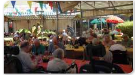
Fête de l'été du 24 juin 2015

Un des objectifs de l'association est aussi de proposer un voyage de plusieurs jours aux usagers de l'EHPAD « Les Chanterelles », ainsi que des sorties ponctuelles (cinéma, rencontres inter-établissements et intergénérationnelles, musées, zoo, aquarium, spectacles à l'extérieur, lieux en lien avec l'histoire des résidents...).